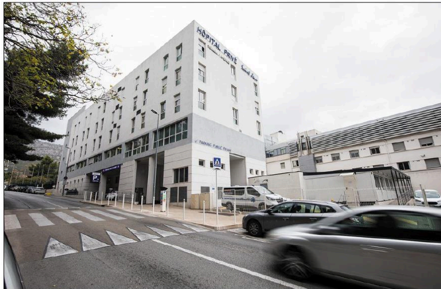
La clinique Saint-Jean gagne du terrain... et reste à Toulon !

La proposition de la Ville a trouvé un écho positif. Le groupement Sainte-Marguerite a fait une offre d'achat concernant « le terrain de sport, le parking et le logement de gardien » de l'école Sainte-Catherine. La clinique pourrait ainsi s'étendre sur 1 850 m 2 supplémentaire. Cette offre, d'un montant de 2,2 millions d'euros,